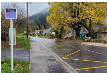
Marquage au sol des arrêts de bus de Bonnetière et du Croz

Rappel des différents travaux et agencements réalisés durant les derniers mois.