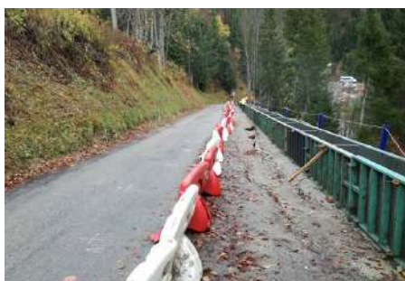
Aménagement et sécurisation de la route de Guilletière