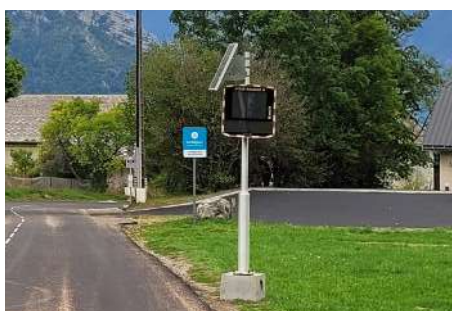
Pose du radar fixe temporaire pour étude et ralentissement de la vitesse.