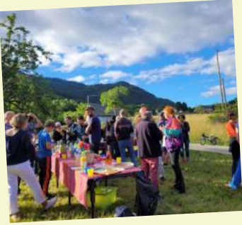
Fête des Hameaux organisée par LCS