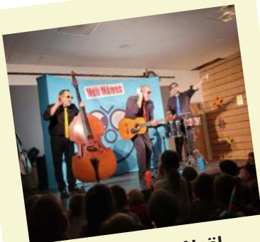
Spectacle de Noël organisé par LCS