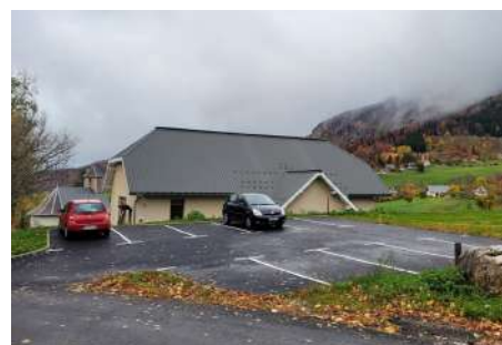
Création du parking de la salle Hermine et d'une place adaptée aux PMR (Personnes à Mobilité Réduite)