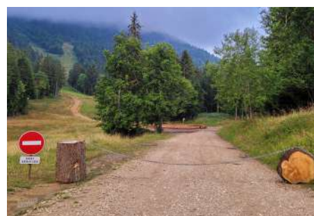
Interdiction de circulation pour la préservation des prairies de départ vers Chamechaude