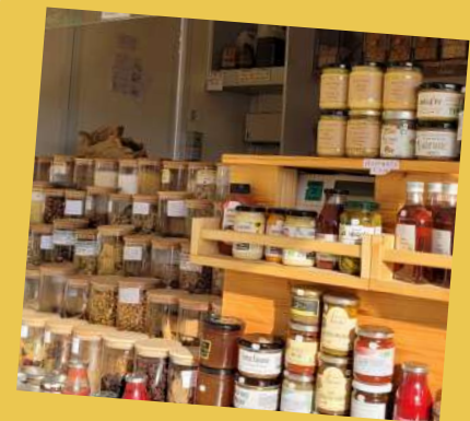
Mini-marché mensuel le 2 nd mercredi du mois