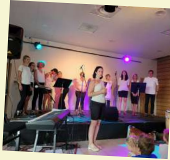
Concert de la chorale organisé par LCS