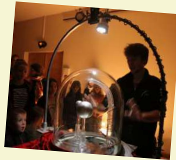
Jour de la Nuit organisé par LCS