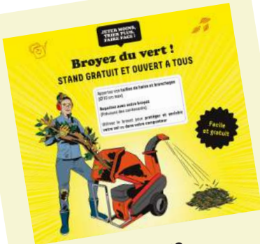
Broyage de déchets verts