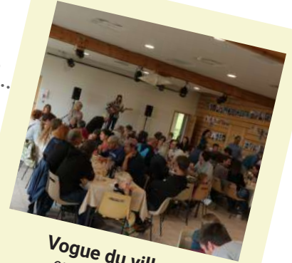
Vogue du village organisée par LCS