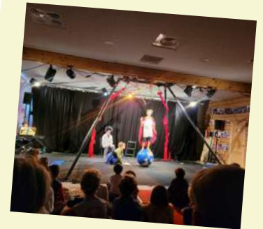
«10 Jours de la Culture» organisé par LCS