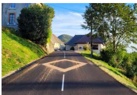
Marquage au sol de deux ralentisseurs visuels en entrée et sortie du centre village.