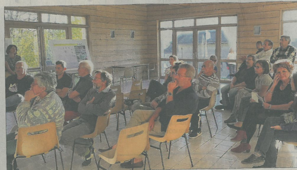
Pour Noël 2018, une place de village conviviale et sécurisée a été présentée aux habitants.

Plus d'informations : mairie : www.sarcenas.com ou les lundis et jeudis après-midi au 04 76 88 82 31.